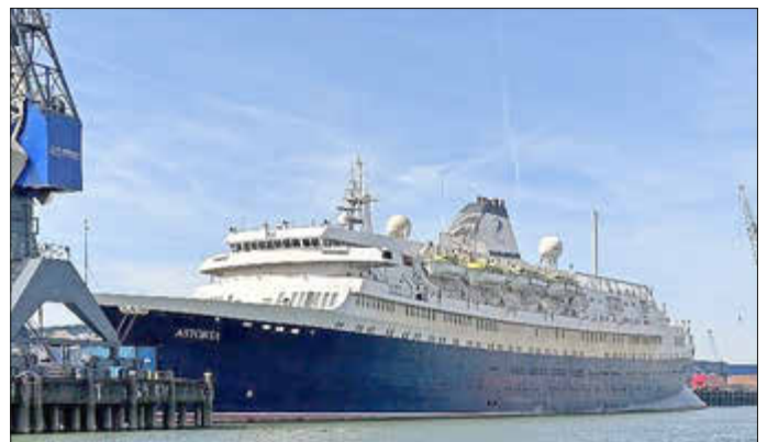
Die Astoria im Hafen von Rotterdam (2023)