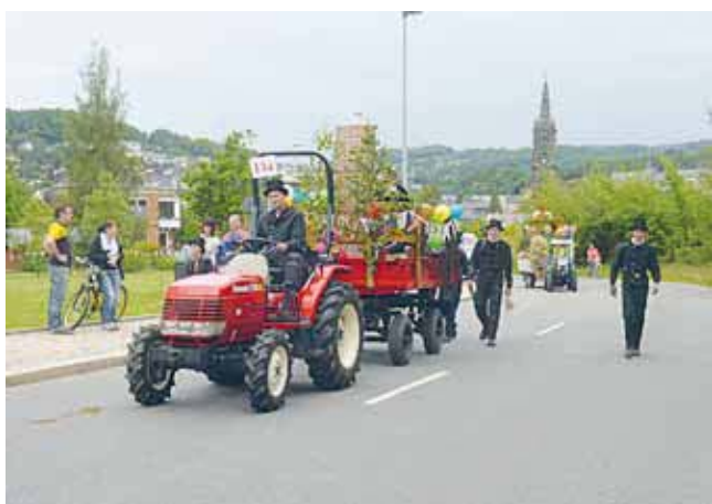
Das Glück wartet vor der Tür. Beim Festumzug präsentierten sich neben Vereinen, Schulen und Kindertageseinrichtungen auch die Gewerbetreibenden der Stadt Kirchberg.