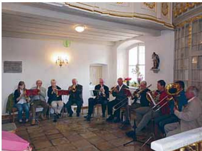
Festgottesdienst am Sonntag, dem 10.06.2012, der evangelisch-lutherischen Kirchgemeinde in der St. Margarethenkirche.