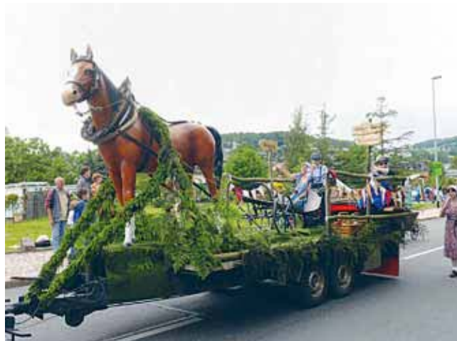
Auch die Ortsteile der Stadt Kirchberg präsentierten sich mit einmaligen Ideen zur Geschichte ihrer Heimat.