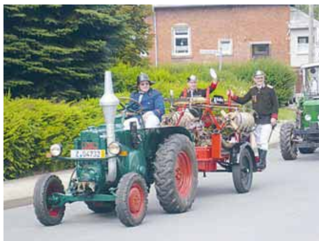
„Hurra ... die Feuerwehr ist da!“ Beim Festumzug zeigten die Mitglieder der Stadt- und Ortsfeuerwehren u. a. ihre historischen Löschfahrzeuge.