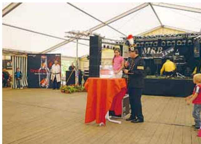
Fortuna, die Göttin des Glücks, war bei der Tombola am Sonntagabend sehr gefragt. 76 Gewinne galt es, an Kirchberger und Gäste aus nah und fern zu übergeben.

Über mehrere Ausgaben der „Kirchberger Nachrichten“ blickten wir auf die Festwoche zur 800-Jahr-Feier zurück. Nun haben wir