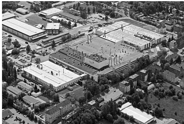
Johnsons Controls am Standort Reichenbacher Straße in Zwickau.

dieses Bauabschnittes betragen ca. 550.000 Euro. Ende April 2012 konnte der 2. Bauabschnitt in Betrieb gehen. Somit sind die Voraussetzungen für die der Firmenentwicklung angepassten Abwasserentsorgung gegeben.