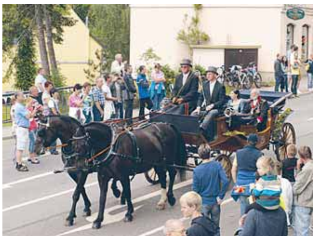
Bereits 1883 besuchte Seine Majestät König Albert von Sachsen die Stadt Kirchberg. Zur 800-Jahr-Feier ließ er es sich nicht nehmen, der Stadt einen erneuten Besuch abzustatten.