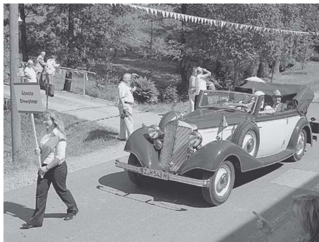
Höhepunkt des Heimatfestes - Der historische Festumzug am Sonntag - Mit dabei: Wolfersgrüns ältestes Ehepaar.