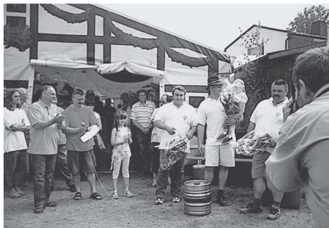
▲ Gewinner beim diesjährigen Wettessen - die „Stumpfen Sensen“ aus Wildenfels