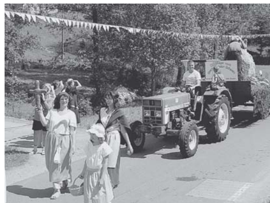
„Die Sage vom Semmelkreuz“ - dargestellt in einem Bild des historischen Festumzuges. ▼