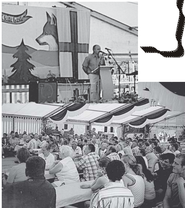
▲ Die Kirchen luden am Donnerstag zum „Offenen Abend“ ein.