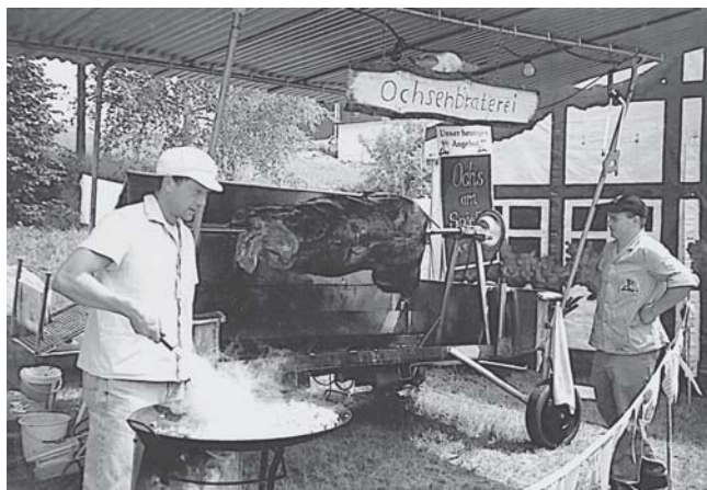
◀ Bestens gesorgt war auch für das leibliche Wohl mit Ochs am Spieß und vielen anderen Leckereien.