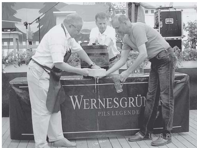
Eröffnung des Heimatfestes mit Bieranstich durch den Bürgermeister.

Der Sonntag stand ganz im Zeichen des historischen Festumzuges. Bei strahlendem Sonnenschein bejubelten Tausende die vielen Bilder, Fahrzeuge und Kapellen, die sich in einem kilometerlangen Zug durchs Dorf bewegten. Über 200 Einwohner aus Wolfersgrün und umliegenden Orten waren be-