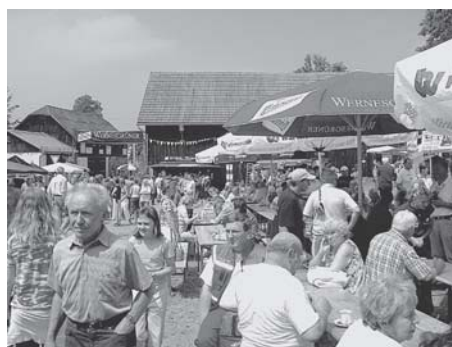
◀ ▲ Der historische Handwerksmarkt - ein Anziehungspunkt am Samstag und Sonntag.